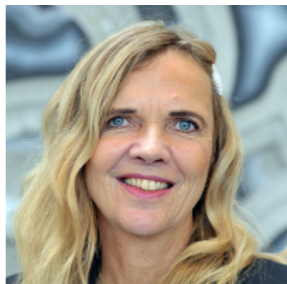
Inga Bolstad Riksarkivar Arkivverket