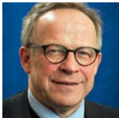
Lars Peder Brekk Direktør Brønnøysundregistrene