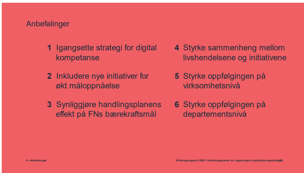
Figur 2, Digdirs anbefalinger til KMD i erfaringsrapport for handlingsplanen

Digdir har utarbeidet en rapport basert på erfaringene fra oppfølging av handlingsplanen i 2020. Denne er sendt til KMD med følgende anbefalte tiltak: