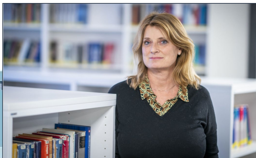
Hanne Harlem tiltrådte som sivilombudsmann tidlig i 2020, et år som så en stigning i innsynssaker.