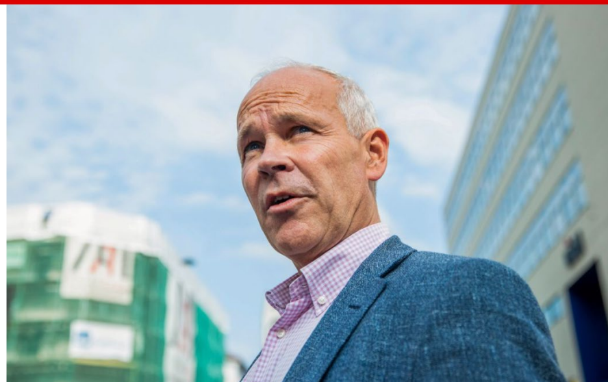
FINANSMINISTER: Jan Tore Sanner (H) er finansminister.