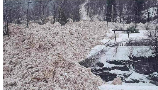
Et sørpeskred i Beisfjorden i Narvik kommune har rast over veien. Politiet har stengt av området og gjør fortløpende vurderinger med tanke på risiko.

Søndag formiddag raste et stort sørpeskred over Beisfjordveien i Narvik kommune. Politiet evakuerer alle i nærområdet og har stengt av fire kilometer vei.