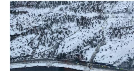
Politiet ser av bilder som er tatt fra luften inn i skredområdet, at det er stor fare for flere skred i området.

En person er alvorlig skadd etter jordskredet på riksvei 80 mellom Bode og Fauske. Det er stor fare for flere skred i området, melder politiet. Veien blir sperret inntil videre.