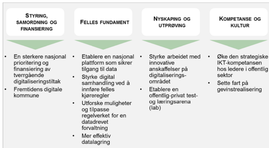
Figur 2 Tiltak i digitaliseringsstrategien

De 10 tiltakene i digitaliseringsstrategien er oppsummert i figur 2 nedenfor.