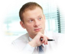
IT-ansatte, arkivmedarbeider, systemeier/utvikler/prosjektleder