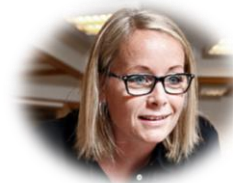
Ansatt med ledelsesansvar

Håndterer i liten grad personopplysninger