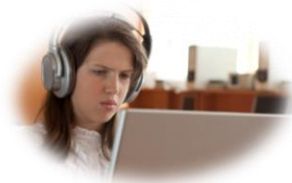
Saksbehandler med innbyggerrettede oppgaver