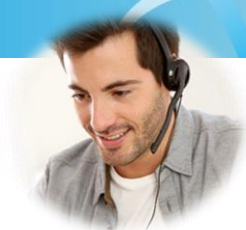
Saksbehandler med administrative oppgaver