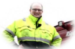
Drift- og renholdmedarbeidere