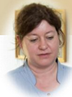
Medarbeider innen helse, pleie og omsorg, barnevern og sosial