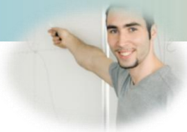
Lærere og barnehageansatte